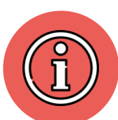
OFFICE DE TOURISME