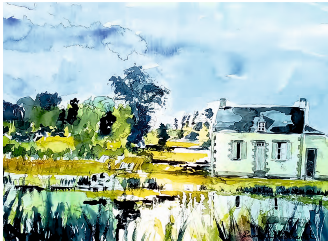
« Maison éclésièrre de Boju » - Laurent Colsenet

Bienvenue à Gueltas. Au cœur de son écrin de verdure le Domaine des CAN'HALTES de Boju.